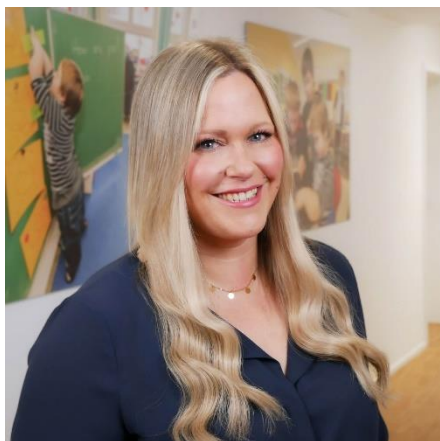
Ninja Driesen Leitung